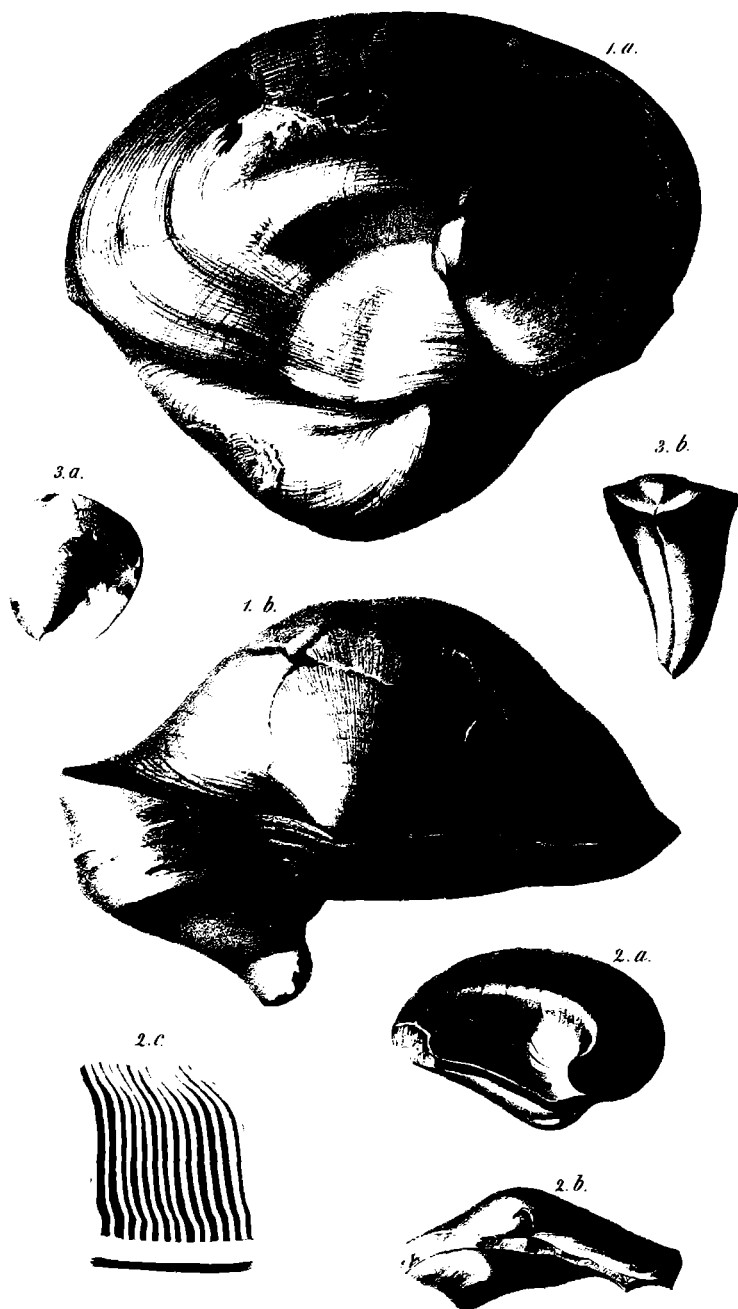
Fig. 1. Caprina exogyra n.sp. in nat. GröÙe (a von unten, b von vorne) Fig. 2. Ein jungendliches Exemplar derselben Art. (a von unten, b von vorne, c Ein Theil der Randkanäle der Oberklappe vergrößert.) Fig. 3. Caprotina exigua n.sp. (a von oben b von vorne.)